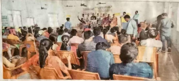
विजेताओं और प्रशिक्षुओं को संबोधित करते प्राचार्य।