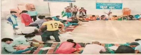
प्रतियोगिता में शामिल छात्र-छात्राएं