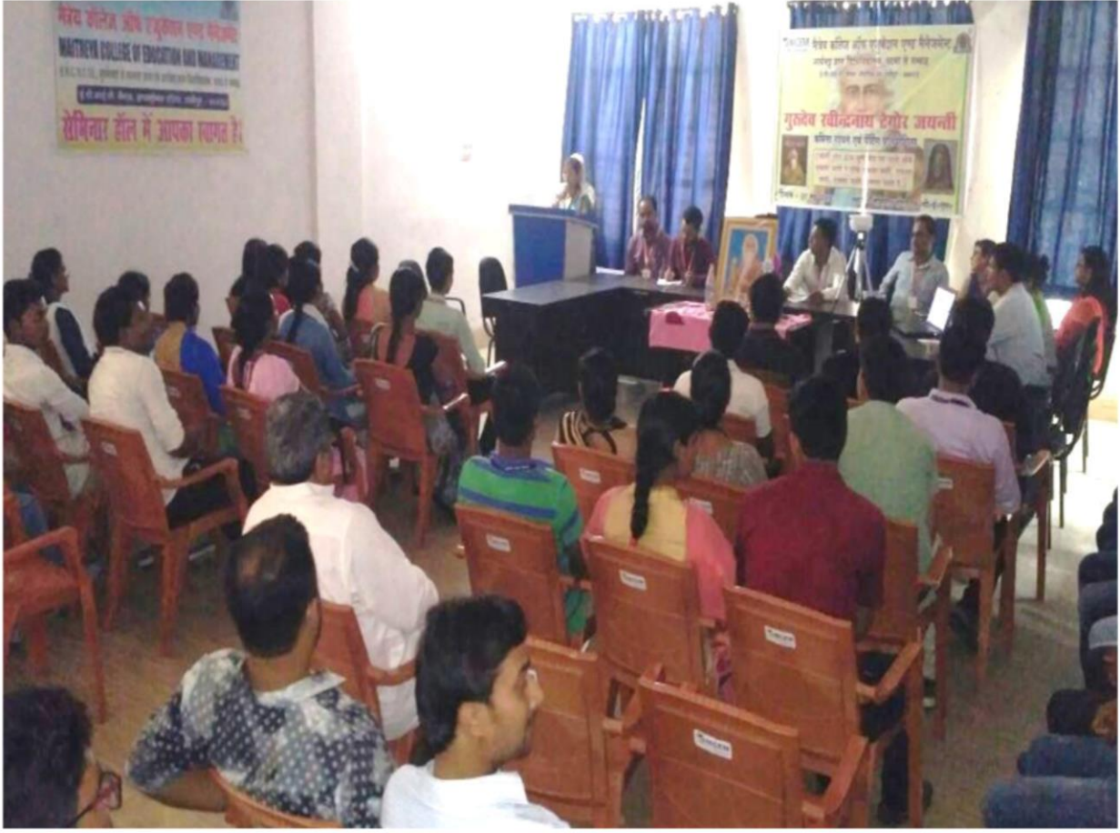
सेमिनार हॉल में आयोजित कविता गायन में भाग लेते प्रशिक्षु