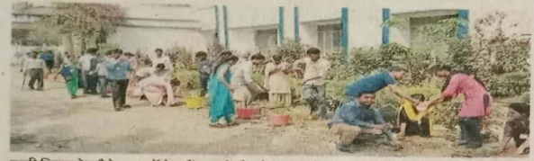
पृथ्वी दिवस के मौके पर कॉलेज कैम्पस में पौधरोपण करते छात्र व छात्राएं