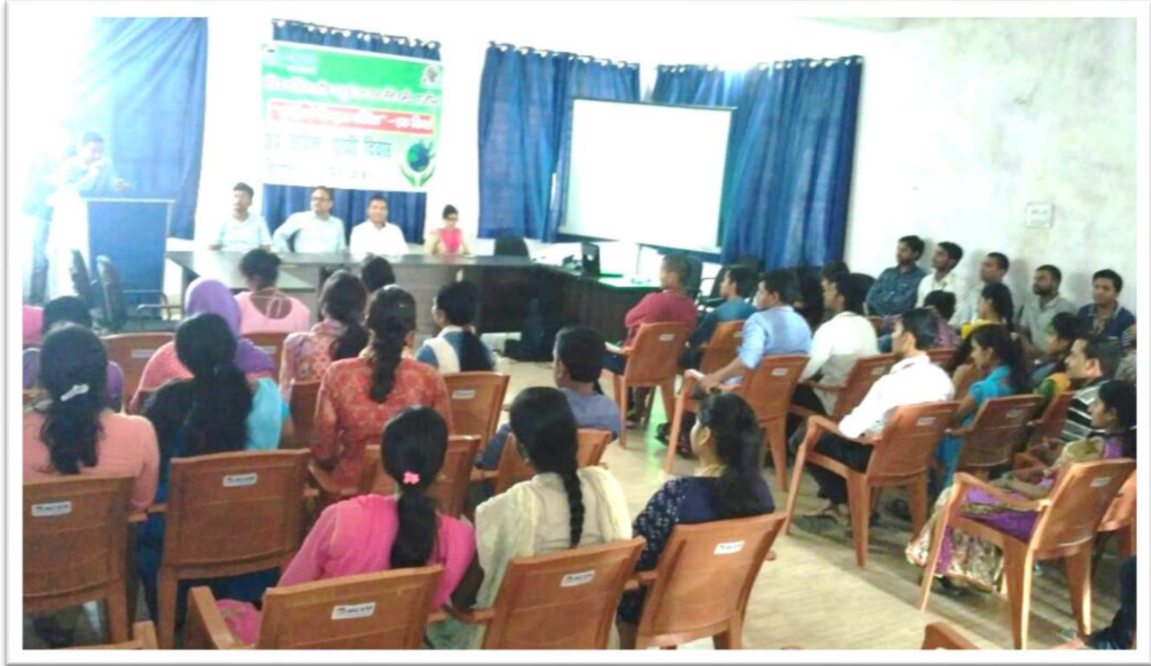
पृथ्वी दिवस पर विमर्शशाला में भाग लेते प्रशिक्षु