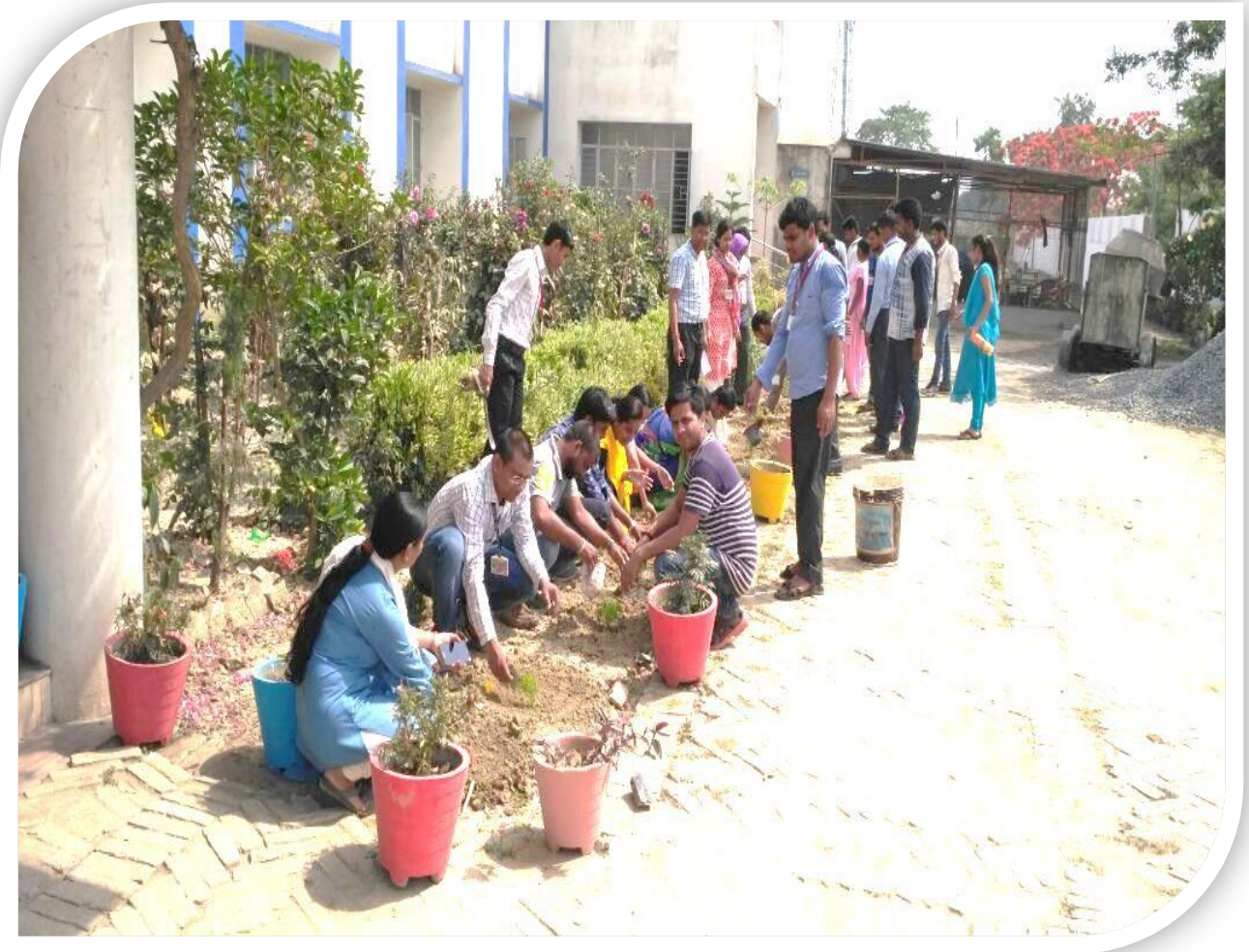
पृथ्वी दिवस पर पौधा रोपण करते प्रशिक्षु

इस विमर्श शाला में भाग लेने से पूर्व प्रशिक्षुओं एवं संकाय सदस्यों ने संस्थान के प्रांगण में कुचिया के 30 पौधों का रोपण कर संकल्प लिया कि संस्थान में पौधों की संख्या बढ़ाना है तथा अपने घरों के आसपास एक वृक्ष का पौधा लगाकर उनका पोषण एवम सुरक्षा करना है।