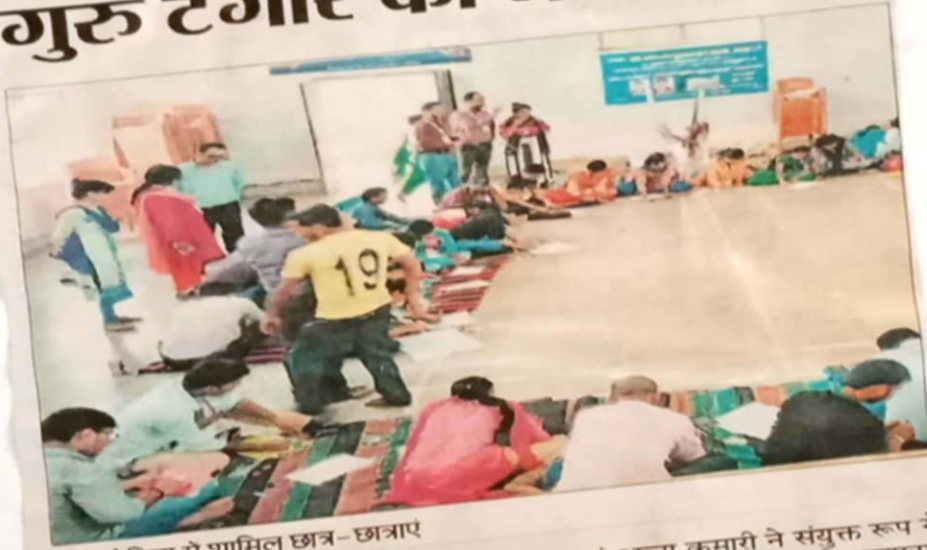
प्रतियोगिता मे शामिल छात्र-छात्राएं